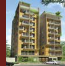
ANA SANTOLINA PUROBI 19, 20 New Baily Road ,Dhaka