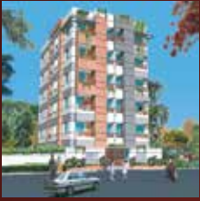
ANA HAIDER PLAZA Plot # 72, Road # 15 Sector - 12, Uttara Model Town