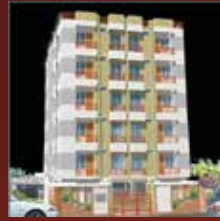
ANA EVAN Plot # 6, Rd # 12/A Sector 10, Uttara