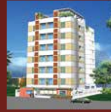
ANA TITAS Plot # 71/D, Road # 12/A Sector 10, Uttara R/A, Dhaka.