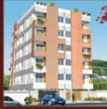
ANA SABINA PLAZA @ Sonargaon Janapath Uttara Model Town