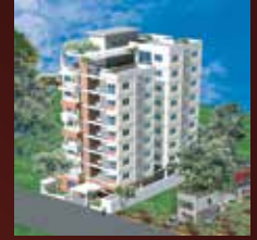
ANA SOLAIMAN TOWER Middle Badda, Dhaka.